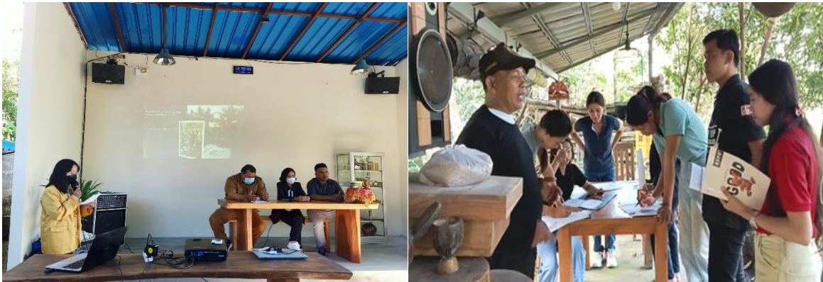
Gambar 6. Pertemuan untuk Mendiskusikan Kegiatan yang Dilaksanakan

Keberadaan ruang pertemuan cukup luas untuk berdiskusi menjadi pelengkap yang mendukung kegiatan edukasi dari para pelajar dan peneliti. Konsep pengelolaan taman tematik yang dilaksanakan dalam kegiatan pengabdian ini memberikan inspirasi dan ide kreatif untuk didiskusikan dan sosialisasi dapat dilaksanakan pada ruang pertemuan yang telah disediakan. Ekowisata bertujuan untuk memberikan pengalaman yang mendidik bagi pengunjung sekaligus menjaga kelestarian lingkungan dan meningkatkan kesejahteraan masyarakat. Lebih lanjut Febryano & Rusita (2018) menyatakan bahwa pengunjung yang datang ke objek ekowisata secara tidak langsung dapat memahami bahwa konservasi flora dan fauna merupakan hal yang sangat perlu dan penting untuk dilestarikan. Selanjutnya Theingtha (2017) menjelaskan bahwa ada tujuh indikator pengembangan ekowisata yaitu: lingkungan, sosial budaya, ekonomi, pemasaran, spiritual, tradisi agama dan kebijakan. Kegiatan pertemuan untuk membahas dan mengkaji pelaksanaan pengabdian dan penelitian dapat diadakan pada ruang diskusi yang telah disediakan. Diskusi pembahasan kegiatan pembelajaran yang dilaksanakan pada ekowisata budidaya lebah madu dapat disosialisasikan dan di diskusikan pada tempat pertemuan (Gambar 6).