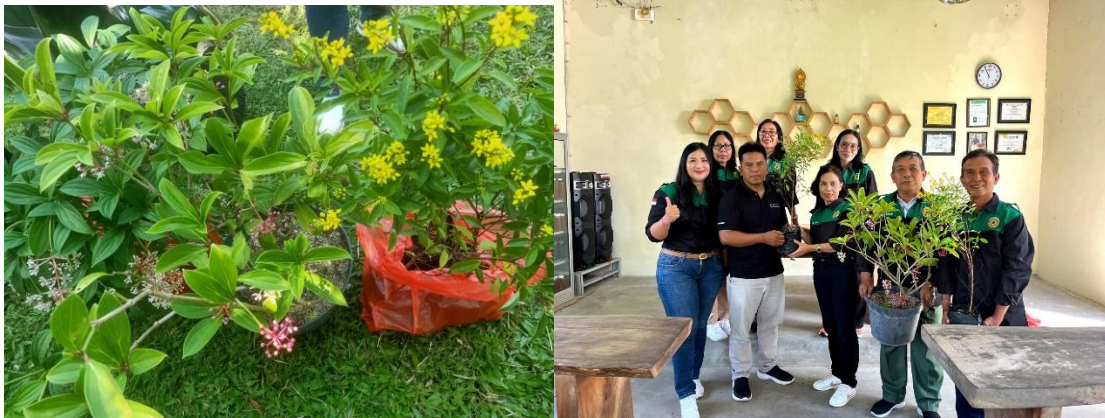
Gambar 2. Penyerahan Tanaman Bunga Sumber Pakan Lebah Madu Trigona sp.

memberikan beberapa jenis tanaman bunga untuk dijadikan sumber penyedia pakan, seperti: tanaman bunga air mata pengantin, santostemon, tanaman bunga hujan emas, jastropa, kembang matahari dan margot. Beberapa lahan di kawasan budidaya masih ada yang kosong dan perlu ditanami tanaman bunga sebagai sumber pakan lebah, maka dalam kegiatan pengabdian dilaksanakan penyerahan tanaman ke pihak pengelola (Gambar 2).