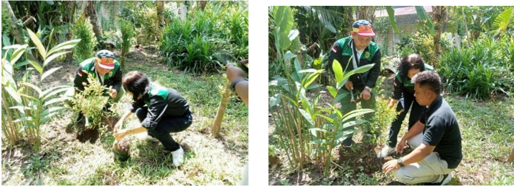
Gambar 3. Tim Pengabdian Melakukan Penanaman Tanaman Bunga Sumber Pakan

Ketergantungan lebah madu Trigona sp. pada nektar dan polen menjadi makanan penunjang kehidupan lebah, sedangkan resin yang dihasilkan tumbuhan bermanfaat untuk pembuatan sarang atau propolis. Ketersediaan tumbuhan sumber pakan dapat mempengaruhi perkembangan dan keberlanjutan koloni lebah. Keanekaragaman jenis tanaman bunga dan pohon buah-buahan sebagai sumber pakan lebah menjadikan madu yang dihasilkan lebih berkualitas. Lebah dan tanaman berbunga memiliki hubungan yang saling menguntungkan yaitu tanaman memberi lebah nutrisi dalam bentuk nektar, polen, dan propolis, sedangkan lebah menyerbuki tanaman di sekitarnya. Jumlah vegetasi tumbuhan sumber pakan mempengaruhi tingkat keberhasilan budidaya lebah, apabila vegetasi pada kawasan budidaya rapat dan beragam maka ketersediaan pakan untuk lebah madu cukup tersedia dan sebaliknya jika jumlah vegetasi terlalu jarang/kurang rapat dan tidak beragam, maka sumber pakan lebah madu menjadi menurun sehingga mempengaruhi keberhasilan budidaya lebah madu. Hal ini didukung oleh pernyataan Wu P et al. (2018) bahwa kualitas lingkungan sangat dipengaruhi oleh kompleksitas struktur dan komposisi vegetasi yang memengaruhi keanekaragaman lebah.