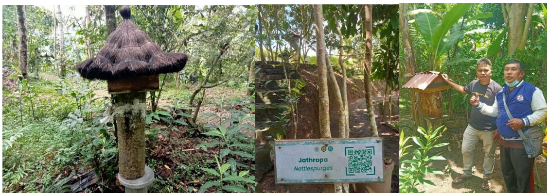
Gambar 5. Rumah Kotak Koloni Lebah

Ketersediaan tanaman bunga dan pohon buah-buahan sebagai sumber pakan lebah madu Trigona sp. yang tersebar di kawasan budidaya memberikan peluang untuk mencari pakan disekitarnya. Rumah kotak koloni lebah untuk membentuk propolis sebagai tempat madu dapat ditempatkan disekitar kawasan (Gambar 5).