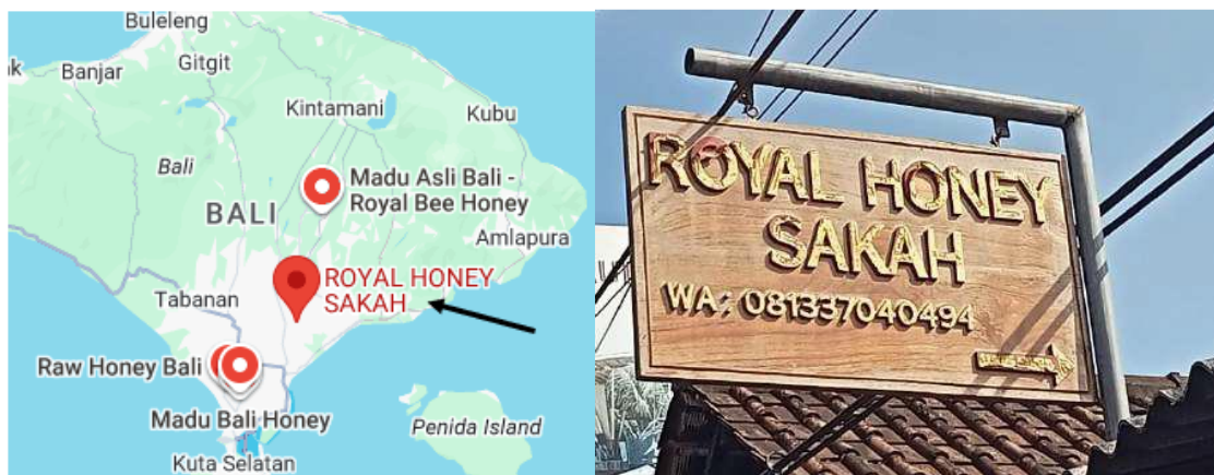
Gambar 1. Lokasi Ekowisata” Royal Honey” Sakah, Gianyar

Ekowisata lebah madu “Royal Honey” Bali berada di Banjar Sakah Desa Batuan Kaler Kecamatan Sukawati, Kabupaten Gianyar. Lokasi yang sangat strategis di daerah pariwisata (jalur Denpasar dengan pusat seni daerah Ubud, Taman Burung, Bali Zoo dan tempat wisata lainnya. Keberadaannya di jalan raya Batuan - Sakah dengan “Patung Bayi”, sehingga ekowisata lebah madu Trigona sp. lebih populer disebut ekowisata Royal Honey Sakah. Budidaya lebah madu ini dimulai sejak bulan April tahun 2017 hingga sekarang, dikelola bersama kelompok tani lebah madu Trigona sp., serangga ini di Bali disebut lebah kele atau kelulut. Kawasan Banjar Sakah Desa Batuan Kaler ini sangat cocok sebagai lokasi pengembangan budidaya lebah madu Trigona sp. karena lokasinya berada didaerah pinggiran kebun dengan potensi sumber daya alam untuk lebah madu berupa ketersediaan bunga vegetasi kebun yang ditumbuhi tanaman bunga, sedang pada tegalan ditumbuhi pohon pisang, aren (enau), alpukat, mangga, nangka, kelapa kuning, terap dan lainnya. Pohon yang ada disekitar ekowisata ini merupakan sumber pakan lebah (Dewandari et.al , 2020). Lokasi Ekowisata lebah madu Royal Honey, dapat dilihat pada Gambar 1.