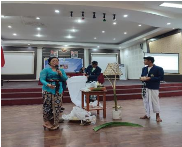
Gambar 1. Presentasi Materi oleh Narasumber