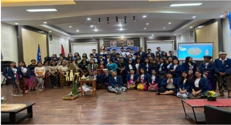
Gambar 4. Evaluasi & Hasil Praktik Pembuatan Banten ari-ari

Setelah dilakukan evaluasi, hasil dilapangan menyatakan bahwa antusias peserta terhadap pelatihan ini cukup besar. Peningkatan pemahaman peserta naik sebanyak 40%. Meskipun dalam pelaksanaannya tetap ada kendala yakni kurangnya kepercayaan diri peserta terutama dalam teknik jahitannya. Pelatihan bukan hanya efektif sebagai media pembelajaran teknis namun juga sebagai sarana penguatan identitas budaya serta karakter generasi muda.