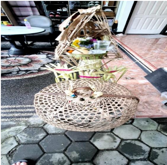
Gambar 5. Banten Sanggah Tutuan dan Banten Ari-ari

Banten – banten sederhana yang di buat dipersembahkan di Sanggah kemulan untuk memohonkan pembersihan akan keberadaan bayi yang terlahir agar sehat dan selamat. Dalam dunia nyata diasumsikan bahwa pelaksanaan upacara yang di persembahkan di sanggah kemulan memiliki makna melapor kepada para dewata. Banten soda putih kuning ucapan selamat datang, lengewangi burat Wangi, gantung-gantungan. Selanjutnya di bawah sanggah tutuan yakni segehan panca warna dipersembahkan kepada Catur sanak dan pertiwi