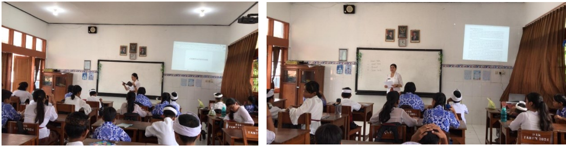
Gambar 2. Kegiatan Siswa Saat Menulis Teks Cerita Fantasi