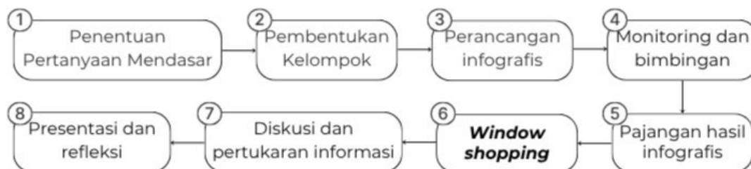
Gambar 1. Sintaks Metode Window Shopping Berbantuan Infografis

Penerapan metode window shopping berbantuan infografis dilakukan melalui beberapa tahapan pembelajaran. Siswa terlebih dahulu diberikan pertanyaan mendasar terkait materi teks anekdot, kemudian dibagi ke dalam beberapa kelompok untuk menyusun proyek infografis berdasarkan teks yang diperoleh. Setelah proses penyusunan dan monitoring proyek, hasil infografis dipajang di dinding kelas untuk kegiatan window shopping . Pada tahap ini, siswa berbagi peran sebagai penjaga toko dan pengunjung untuk mengamati serta mendiskusikan hasil kerja kelompok lain. Kegiatan diakhiri dengan diskusi, presentasi, dan refleksi pembelajaran.