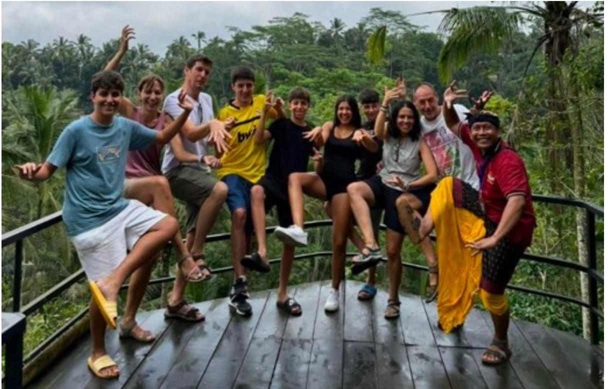
Gambar 1. Suanda Bali Driver Guide

belum memiliki identitas visual (branding) seperti logo atau video profil usaha yang menarik. Padahal, usaha ini memiliki potensi besar karena pelayanannya yang ramah, profesional, dan mampu memberikan pengalaman wisata yang personal.