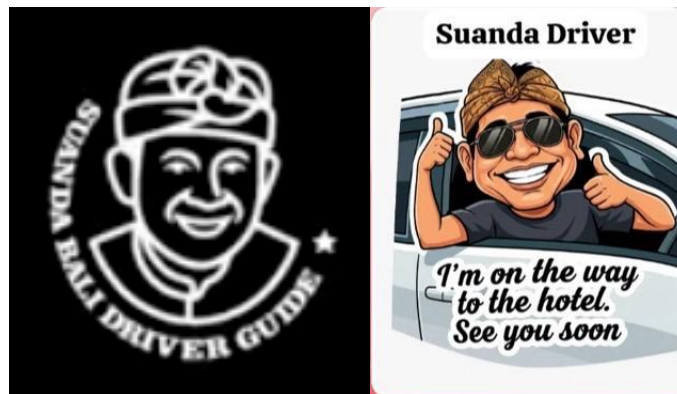
Gambar 4. Logo dan Stiker Messenger Suanda Bali Driver Guide

Berdasarkan permasalahan yang dihadapi mitra, tim pengabdian memberikan solusi berupa perancangan identitas visual dan media komunikasi digital. Target luaran utama dari kegiatan ini meliputi pembuatan logo dan identitas visual, serta video profil promosi berdurasi 2-3 menit. Perancangan logo dan elemen identitas visual didasarkan pada analisis potensi Suanda Bali Driver Guide yang mengedepankan keramahan dan pelayanan profesional. Identitas ini kemudian diaplikasikan ke dalam strategi pemasaran digital ( Digital Marketing ) untuk membangun citra yang lebih profesional dan terpercaya. Selanjutnya, produksi video promosi dikembangkan menggunakan teknologi multimedia berbasis sinematografi digital. Video ini dirancang untuk merepresentasikan nilai pelayanan serta keunggulan kompetitif mitra secara informatif. Setelah melalui proses pengeditan akhir menggunakan Adobe Premiere CC dan dirender ke dalam format .mp4, media promosi tersebut disiapkan untuk dipublikasikan secara luas. Publikasi dilakukan melalui berbagai platform media sosial seperti Instagram, TikTok, dan YouTube, sehingga calon wisatawan lokal maupun mancanegara dapat mengakses informasi layanan tanpa dibatasi oleh jarak dan waktu. Pendekatan pemasaran digital ini secara efektif menjawab kendala mitra yang sebelumnya belum memiliki media promosi digital yang optimal.