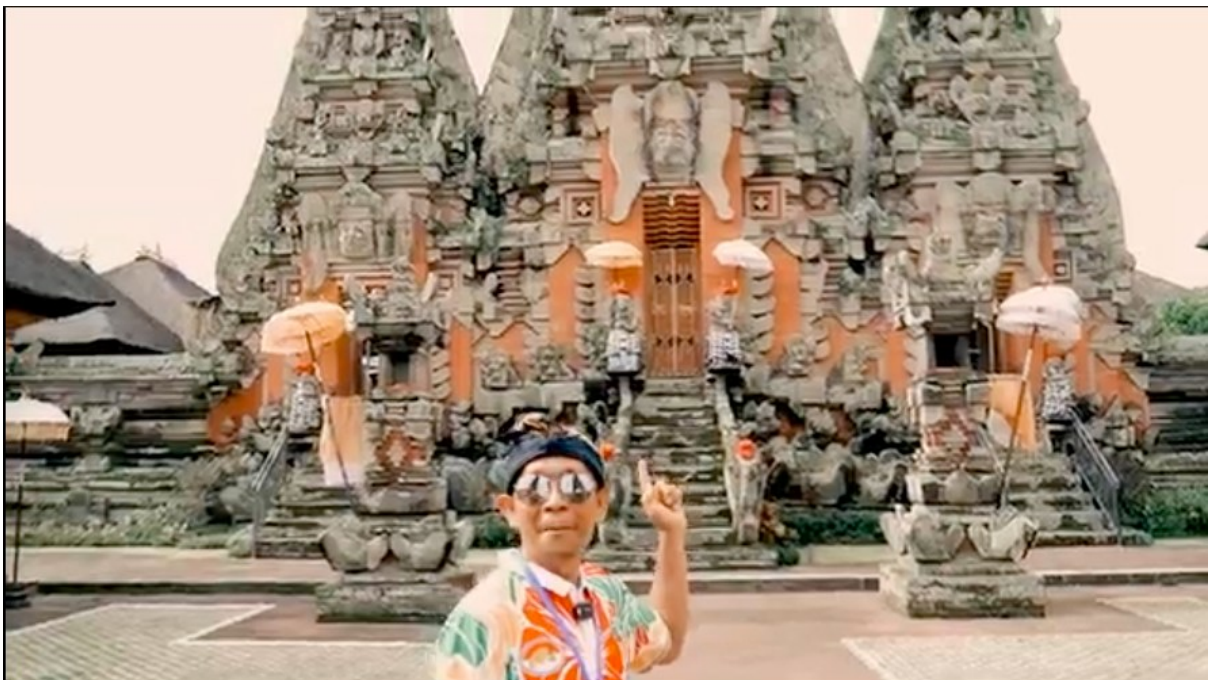
Gambar 5. Potongan Video Promosi