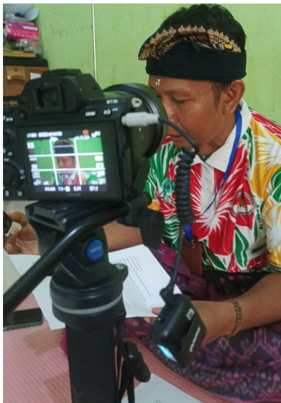
Gambar 3. Proses Produksi Video Promosi