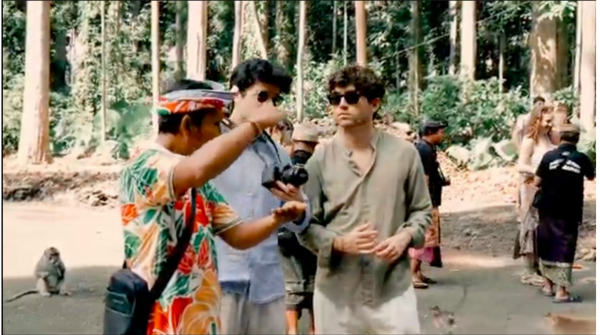
Gambar 6. Potongan Video Promosi