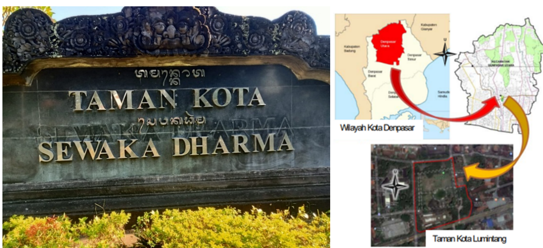
Gambar 1. Taman Kota Sewaka Dharma atau Taman Kota “Lumintang” Denpasar

Pembelajaran yang diterapkan tenaga pendidik atau dosen dengan mengelola keterlibatan mahasiswa secara langsung di lapangan memberi kesempatan untuk membangun ide, memotivasi, kreativitas dan rasa ingin tahu lebih tinggi sebagai bentuk metode pembelajaran kontekstual. Kegiatan praktek kuliah lapangan (PKL) dilaksanakan di taman Sewaka Dharma Kota Denpasar, sering disebut Taman Kota “Lumintang” berlokasi di di Lumintang, Jalan Gatot Subroto Tengah Kecamatan Denpasar Utara, di pusat kantor pemerintahan Kota Denpasar (Gambar 1). Kegiatan PKL ini diharapkan menjadi kolaborasi pembelajaran yang diberikan dalam perkuliahan di dalam kelas dan kondisi nyata yang ditemukan di lapangan menjadi bentuk pembelajaran kontekstual yang menarik untuk menggali inovasi, komunikasi dalam rangka meningkatkan proses pembelajaran. Praktek kuliah lapangan memiliki tujuan yang sama dengan praktek kerja lapangan karena bertujuan untuk meningkatkan pemahaman dan kompetensi mahasiswa. Pelaksanaan PKL memiliki nilai strategis dalam meningkatkan metode pembelajaran dari pembelajaran bersifat abstrak dan monoton di dalam kelas menjadi pembelajaran kontekstual berbasis pengenalan secara langsung objek yang menjadi pembahasan berupa diskusi dalam pembelajaran. Pelaksanaan pembelajaran dengan melibatkan mahasiswa/siswa dapat membangun ide, cara berpikir yang konstruktif terhadap wawasan dengan cara pandang yang bersifat holistik sesuai kondisi faktual di lapangan.