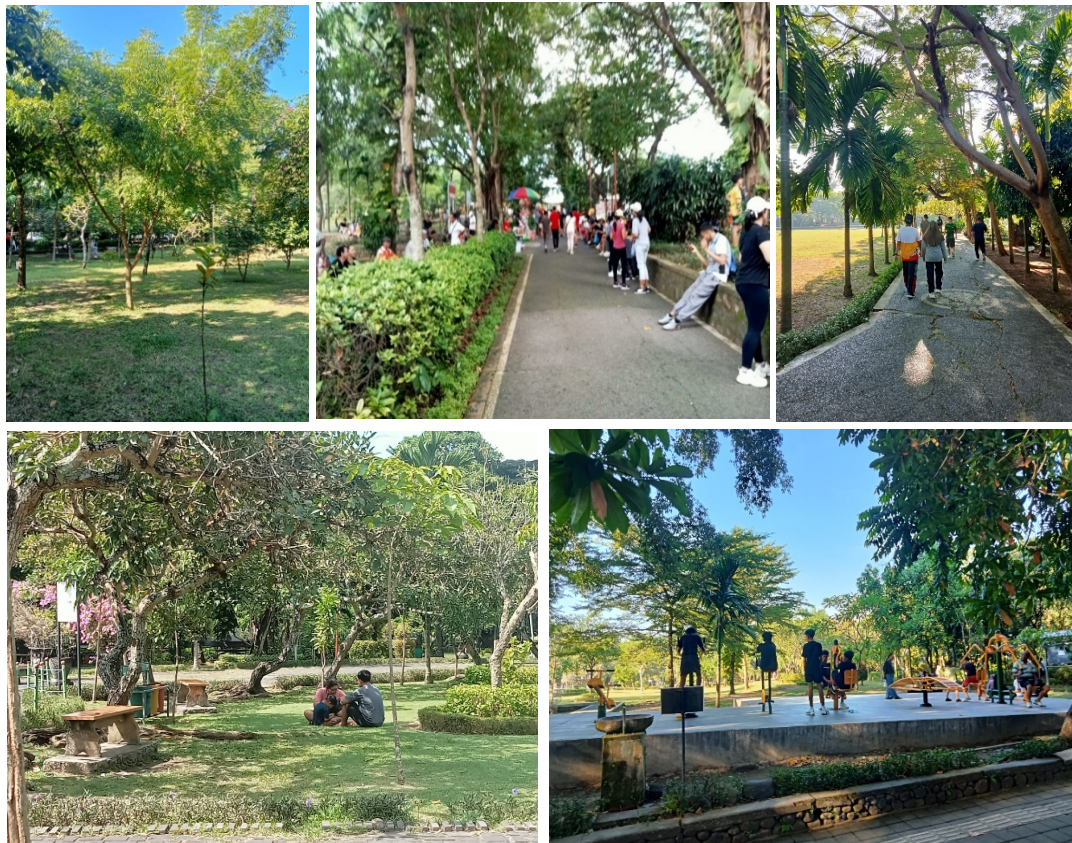
Gambar 3. Taman Sewaka Dharma yang Indah sebagai tempat Rekreasi dan Olahraga

argumentasi yang jelas dan lebih dalam sebagai pemecahan masalah, sehingga memberi motivasi dan interaksi yang meningkat dalam belajar mahasiswa/siswa (Hartik dkk., 2023). Taman Sewaka Dharma menjadi laboratorium alam dalam pembelajaran ekologi tumbuhan menjadi media pembelajaran yang langsung dialami dalam kehidupan dengan manfaatnya dan dapat mempermudah pemahaman mahasiswa/siswa. Pembelajaran yang dilaksanakan di luar kelas secara langsung pada hakikatnya sebagai bentuk pengenalan suatu materi atau objek sebagai media pembelajaran agar lebih mudah dipahami dan adanya pemikiran kritis untuk didiskusikan (Sari dkk., 2023).