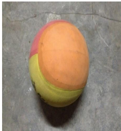
Gambar 1 Bola Spon

keterampilan motorik, kemampuan fisik, pengetahuan dan penalaran, penghayatan nilai-nilai (sikap mental, emosional, spiritual dan sosial), serta pembiasaan pola hidup sehat yang bermuara untuk merangsang pertumbuhan dan perkembangan yang seimbangan. Melalui penggunaan modifikasi media pembelajaran diharapkan para peserta didik mempunyai gambaran tentang pembelajaran bola voli yang diajarkan dan mampu melakukan gerakan passing bawah, servis bawah dan block dengan baik dan mempermudah guru dalam pemilihan variasi media pembelajaran serta membuat peserta didik merasa senang terhadap pembelajaran bola voli. Berikut modifikasi pembelajaran bola voli :