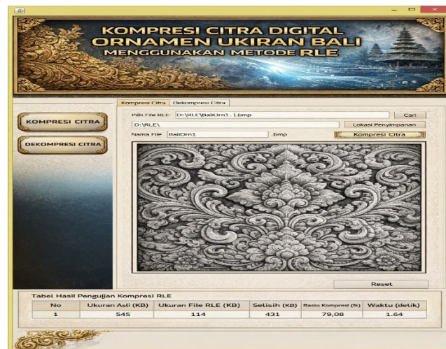
Gambar 2. Implementasi Sistem Kompresi Citra Ornamen Ukiran Bali Berbasis RLE

Tabel 1 memperlihatkan hasil pengujian kompresi citra digital menggunakan metode Run Length Encoding (RLE) pada lima data uji dengan variasi ukuran dan kompleksitas berbeda. Performa kompresi menunjukkan pola yang tidak seragam. Rasio kompresi tertinggi tercatat pada data keempat sebesar 79,08% dengan pengurangan ukuran mencapai 431 KB, mengindikasikan bahwa citra tersebut memiliki area homogen dan pola repetitif dominan sehingga panjang run yang terbentuk relatif besar. Sebaliknya, data ketiga dengan ukuran file paling besar, yaitu 12.621 KB, hanya menghasilkan rasio kompresi 17,04% serta membutuhkan waktu komputasi terlama sebesar 65,05 detik. Kondisi ini menunjukkan bahwa ukuran file dan kompleksitas distribusi intensitas piksel berpengaruh signifikan terhadap efisiensi encoding. Data kedua juga menampilkan performa cukup baik dengan rasio 47,2%. Secara keseluruhan, hasil ini menegaskan bahwa efektivitas RLE sangat bergantung pada karakteristik visual citra dan resolusi data yang diproses.