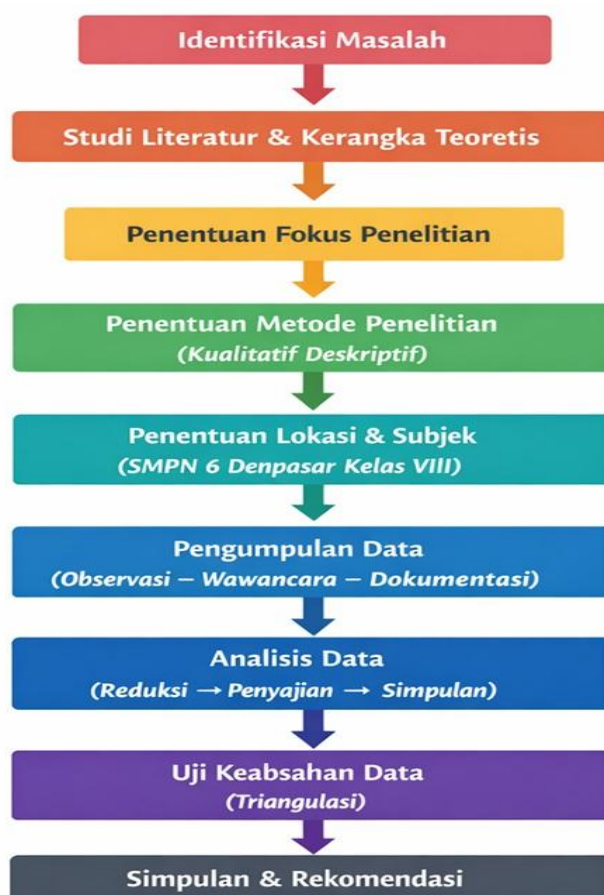
Gambar 1. Flowchart Prosedur Manajemen Pendidikan Ekonomi Jnana Dharma

Prosedur pengumpulan data dalam penelitian ini disusun secara sistematis untuk menjamin keterlaksanaan penelitian yang terarah dan menghasilkan data yang akurat. Tahap awal dimulai dengan pengurusan perizinan penelitian kepada pihak sekolah sebagai bentuk etika akademik dan legalitas pelaksanaan penelitian. Setelah perizinan diperoleh, peneliti melakukan observasi awal guna memahami konteks pembelajaran ekonomi, karakteristik kelas, serta pola pengelolaan pembelajaran yang diterapkan. Tahap selanjutnya adalah pelaksanaan wawancara mendalam dengan guru dan siswa yang dipilih secara purposif untuk menggali informasi terkait praktik manajemen pembelajaran dan integrasi nilai kognitif serta moral. Bersamaan dengan itu, peneliti mengumpulkan dokumen pendukung yang relevan, seperti silabus, RPP, dan perangkat pembelajaran lainnya. Data yang terkumpul kemudian dianalisis menggunakan model analisis interaktif yang meliputi tahap reduksi data untuk memilah informasi penting, penyajian data dalam bentuk naratif, serta penarikan kesimpulan secara bertahap.